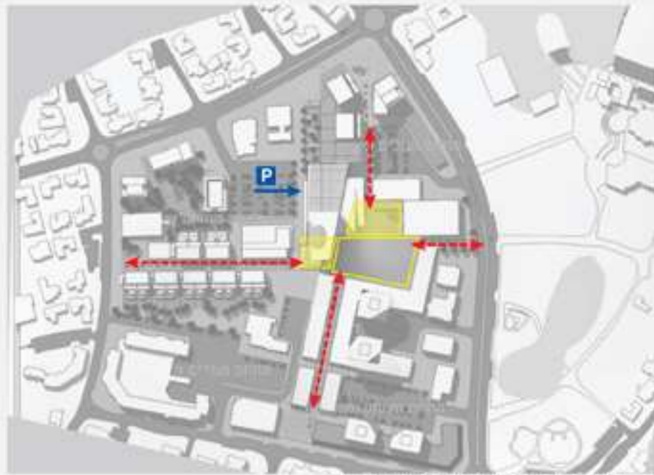
ג. נגישות להולכי רגל ולרכב