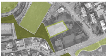
רצף שטחים פתוחים