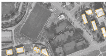
קישור בין רקמות